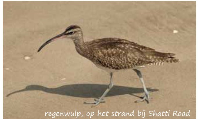
regenwulp, op het strand bij Shatti Road

( www.haya.om/AlAnsabWetland.aspx ). Ze hebben de lagunes vogelvriendelijk gemaakt en maken het de vogelaar/natuurlijefhebber naar de zin met kijkhutten en wandelpaden. Je waant je echt niet op het terrein van een rioolzuivering. Helaas zijn de lagunes alleen te bezichtigen tijdens kantooruren, op afspraak via bovenstaande website. In de trek spijbel ik zo af en toe een paar uur in de ochtend om het toch maar te zien.