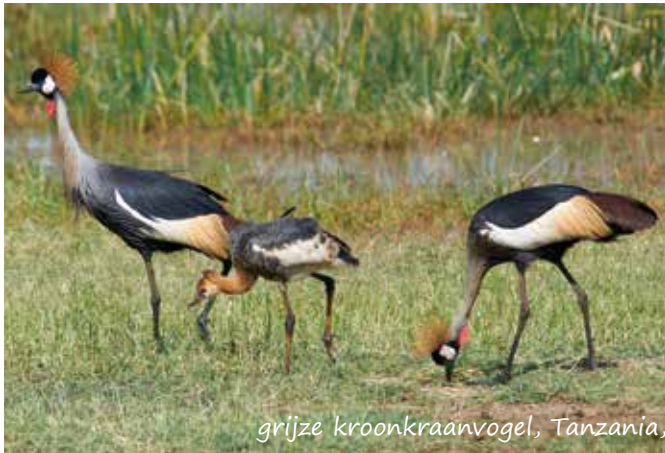
grijze kroonkraanvogel, Tanzania,

namelijk veel minder op het strand en in de mangroves. Dat rondje neemt zo'n drie uur in beslag, met elke keer zo'n 30-40 verschillende vogelsoorten. Elk jaargetij heeft zijn eigen karakter. In de zomer is, begrijpelijk, niet heel veel te zien, maar zelfs dan kan je de Indische scharrelaar met zijn prachtige turquoise vleugels bewonderen. De beste