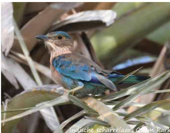
Indische scharrelaar, Qurm Park

Vermeldenswaardig is ook de Al Ansab Lagoon, de kunstmatige lagunes van de Al Ansab rioolzuivering