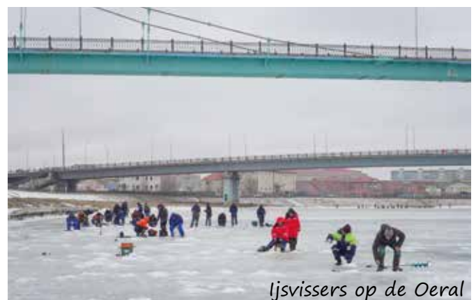
Ijsvissers op de Oeral