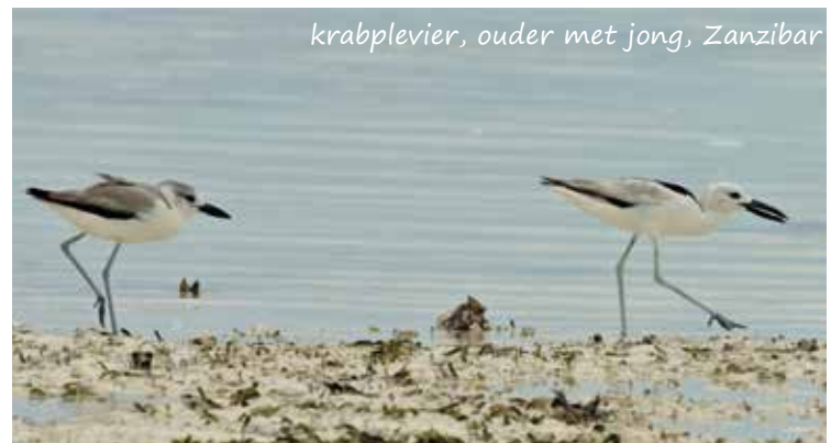
krabplevier, ouder met jong, Zanzibar

Vogelidentificatie heeft veel facetten. Wat je ziet hangt af van de locatie, het weer, de tijd van het jaar en het uur van de dag. Het kan een behoorlijke uitdaging zijn om een vogel te identificeren, vooral buiten het broedseizoen. Zeker voor een beginnende vogelaar kan dit frustrerend zijn, maar de beloning komt als het je steeds gemakkelijker afgaat. Het meest in het oog springend van de vogel is het verenkleed. Daarnaast is observatie van onder andere de vorm, grootte, loop en vlucht een essentieel onderdeel van vogelen. Het verenkleed is bij veel vogels, maar niet bij alle, duidelijk verschillend tussen mannetjes en vrouwtjes. Eerstejaars (en soms tweede- en derdejaarsvogels) kunnen er anders uitzien.