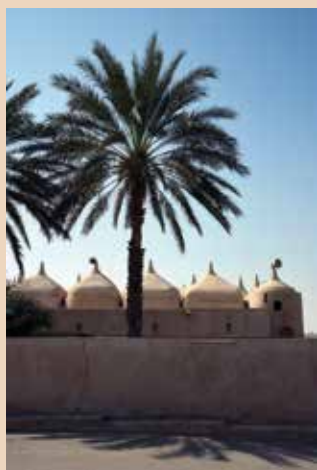
FOTO VOORPAGINA : Jami Al Hamoda Moskee met 52 koepels in Jalan Banu Bu Ali